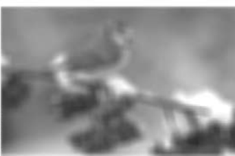
Kataraktos paveiktas regėjimas

gydymo būdas – chirurginė akies lęšiuko pakeitimo operacija. Daugeliu atvejų kataraktos operacijos atliekamos netaikant bendrosios anestezijos, o vietiškai, vaistų pagalba nujautrinant akį. Todėl operacijos metu žmogus išlieka sąmoningas, tačiau visiškai nejaučia skausmo. Anksčiau atliekant tokią operaciją tekdavo akyje padaryti gana didelį pjūvį, kurį susiuvus, ragenos randas gydavo apie pusę metų.