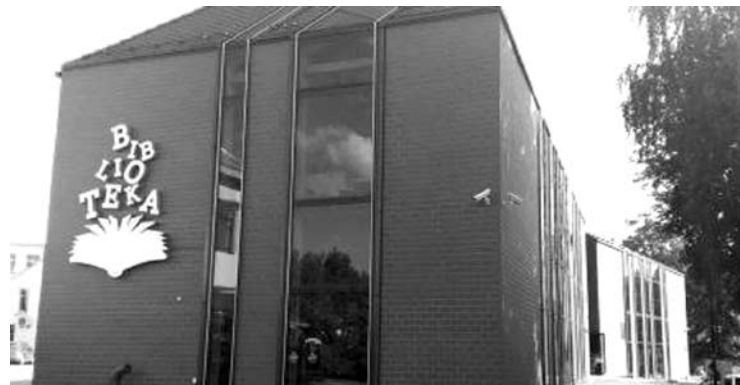
Pernai Anykščių L. ir S. Didžiulių viešojoje bibliotekoje lankėsi nemažai žinomų Lietuvoje žmonių. Tarp jų – kandidatai į šalies prezidentus Arvydas Juozaitis ir Gitanas Nausėda.